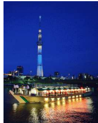
スカイツリーと屋形船