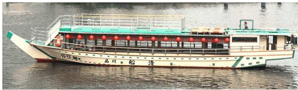
乗船予定の屋形船

当初計画していた屋形船や、スカイツリー近辺を遊覧するコースは以下のイメージです。また座席表や式次第も準備していましたが、突然の欠航により幻の総会となりました。