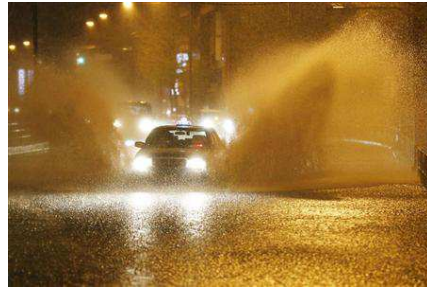
東京都港区の映像