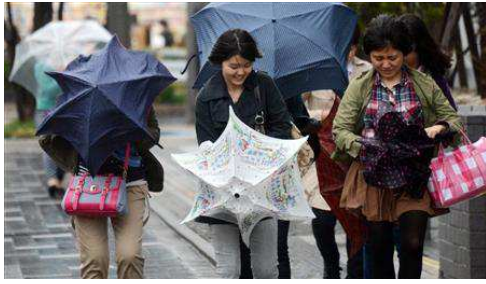
東京お台場の映像