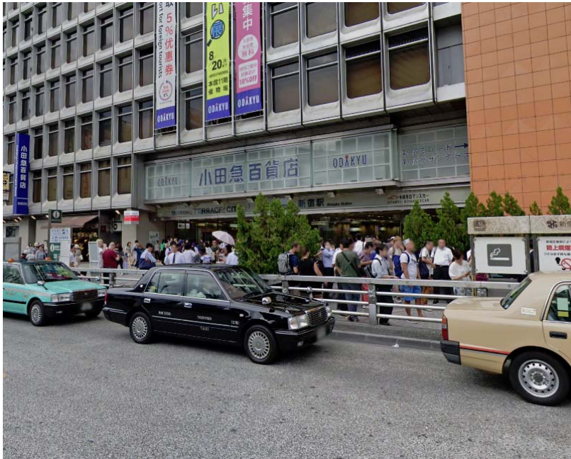
地上改札口を出て屋外へ出たところ